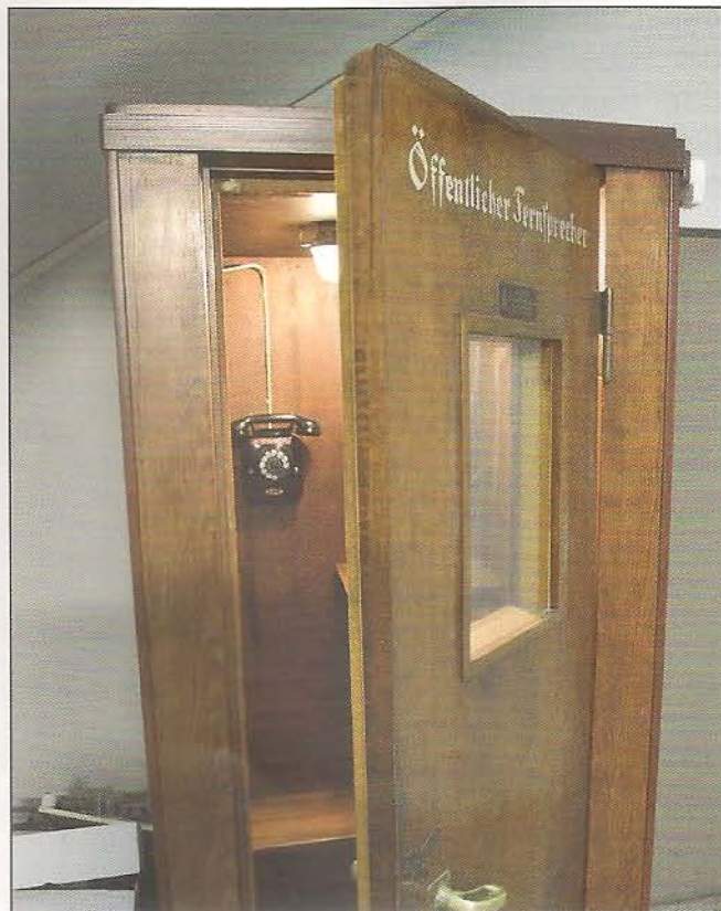
Die original erhaltene öffentliche Fernsprechzelle aus dem Postamt Schlotheim.

So kam eine beeindruckende Sammlung von Exponaten aus den Gründerjahren des Telefons bis zum Ende der analogen Technik zusammen. Der Bogen spannt sich von Telefontypen um 1885 aus Kaisers Zeiten bis hin zu Vermittlungsschränken der Handvermittlungen über die Entwicklungsstufen der Hebdrehwählertechnik von 1922 bis zur Koordinatenschalter-Technik aus dem Jahr 1963. Besonders staunen Besucher auch über eine originale Telefonzelle aus den 1950er-Jahren. Das funktionsfähige Relikt der Kommunikationsgeschichte war noch bis zur Wende 1989/90 im damaligen Postamt Schlotheim in Betrieb.