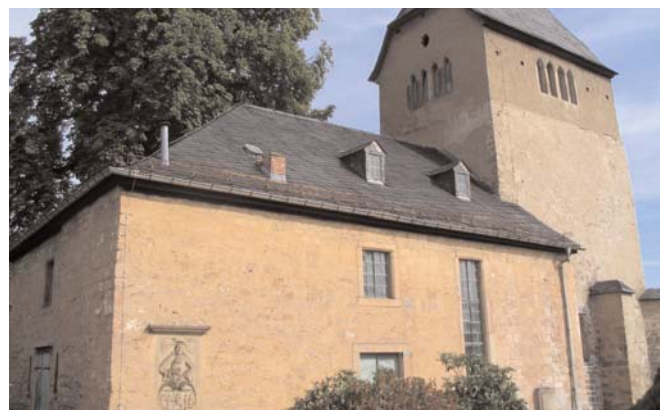
Diese alte Kirche war vor uns Touristen sicher, da sie uns verschlossen blieb.