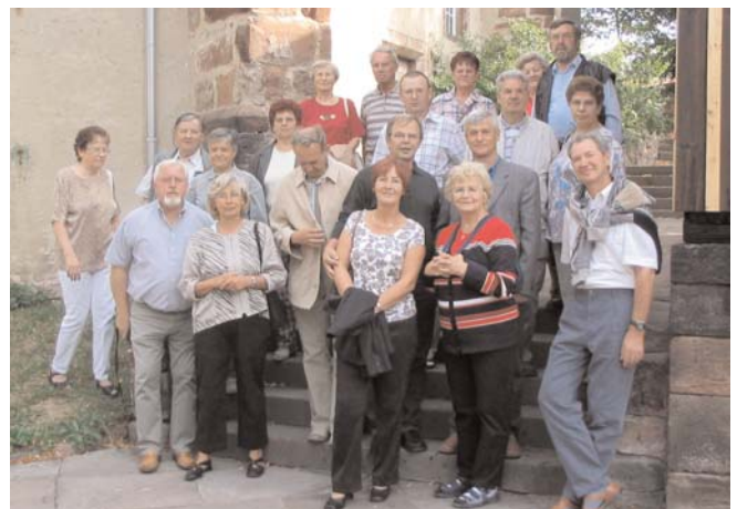
Unsere Reisegruppe beim Stadtrundgang vor der Kirche am Kirchberg .

Pünktlich um 10:00 Uhr waren wir vor dem Museum in Stadtroda. Dort wurden wir von unserem Telekomkollegen begrüßt und in das Museum geführt. Im Heimatmuseum begrüßte uns die Leiterin dieses Hauses und gab einige Einführungen in die Geschichte der Stadt und der Ausstellung. Nach einer Führung durch die Ausstellungsräume machten wir einen Stadtrundgang um einen Überblick über die Stadt zu bekommen. Anschließend wartete das Mittagessen in einer Gaststätte auf uns.