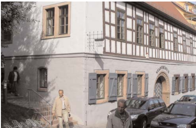
Das Stadtmuseum in Stadtroda wurde erst nach der Wende eingerichtet