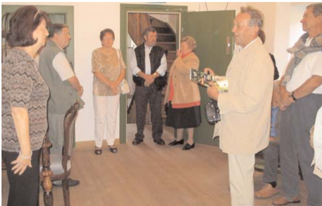
Begrüßungsritual durch die beiden Vorsitzenden der Museumsvereine.